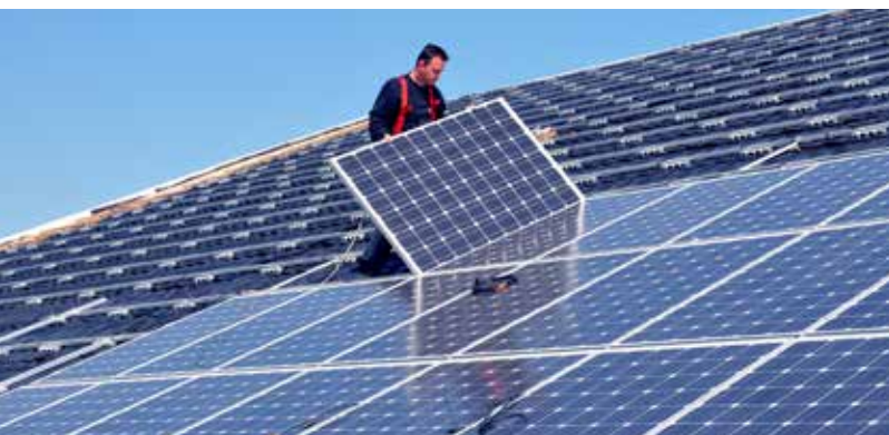
Le solaire photovoltaïque constitue l'un des principaux gisements de production d'électricité renouvelable financés par Sem'Soleil.